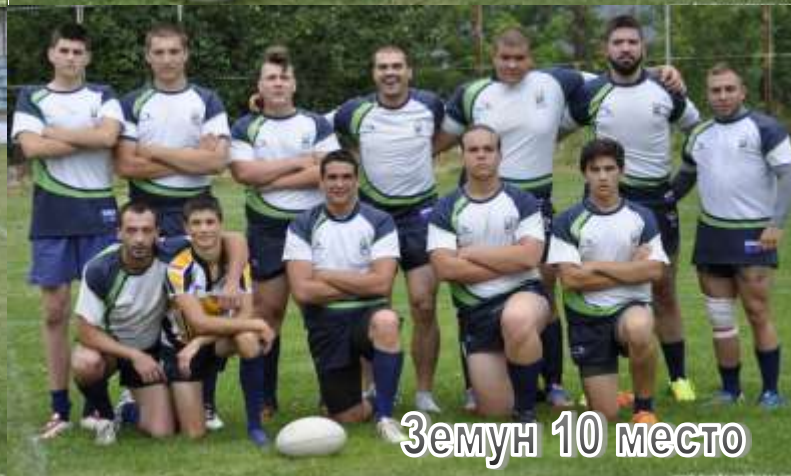
Земун 10 место

Треба истаћи да је 10 екипа било подељено у три групе. Две од по 3 клуба, и једна са 4. Коришћена је формула која је карактеристична за рагби лигу, тако да је слободан пар у групама са 3 клуба, увек играо против клуба из друге групе. На овај начин одигран је већи број утакмица.