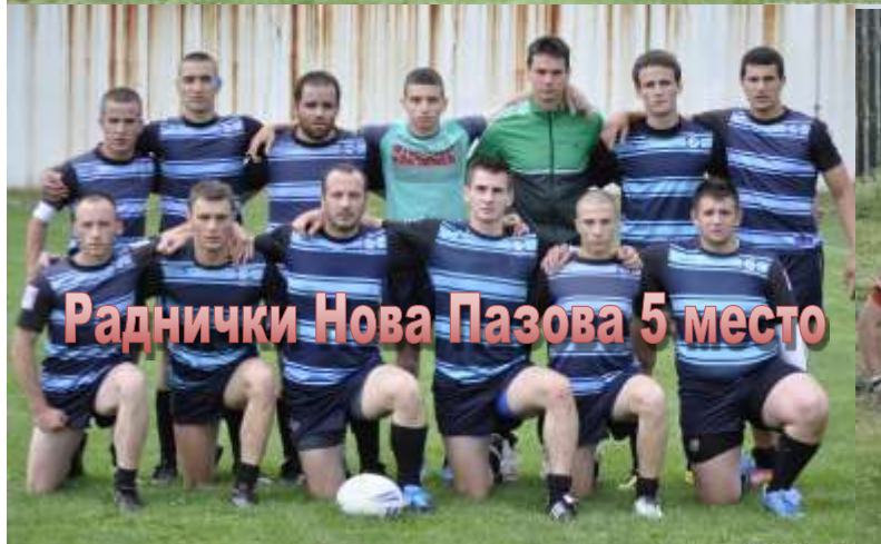
Раднички Нова Пазова 5 место