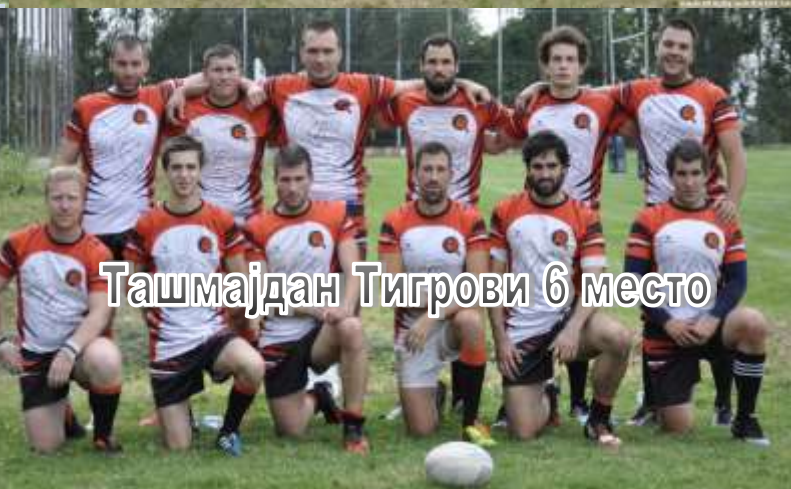
Ташмајдан Тигрови 6 место