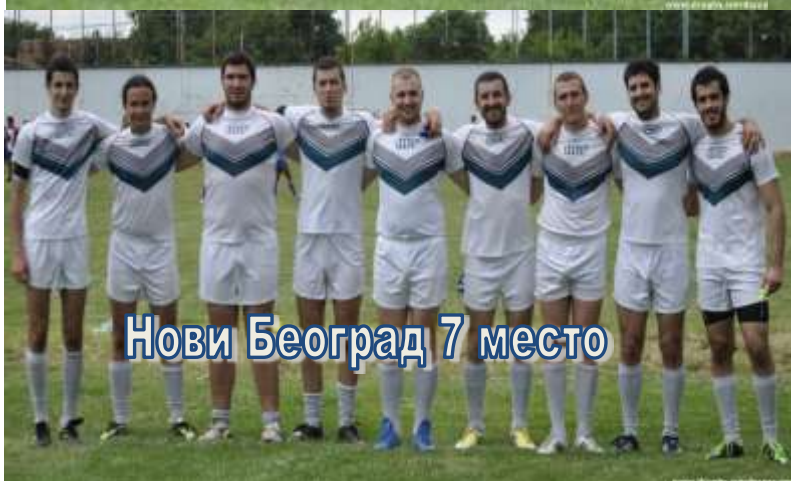
Нови Београд 7 место