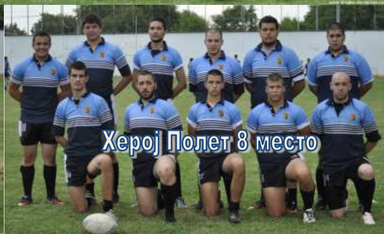
Херој Полет 8 место