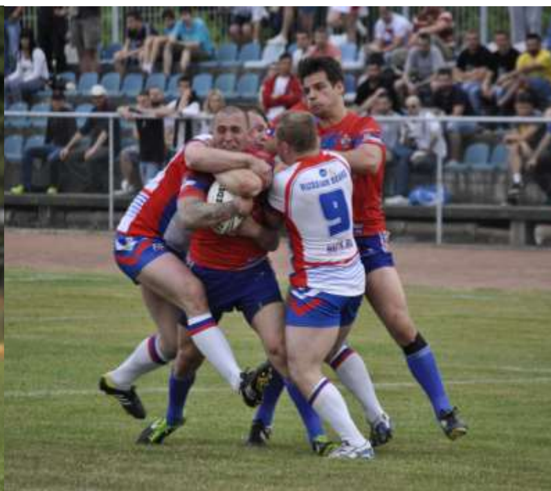
ПРВЕНСТВО ЕВРОПЕ У РАГБИЈУ 13 ГРУПА Б - Београд, НЦ Макиш, гледалаца 50