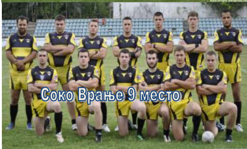
Соко Врање 9 место