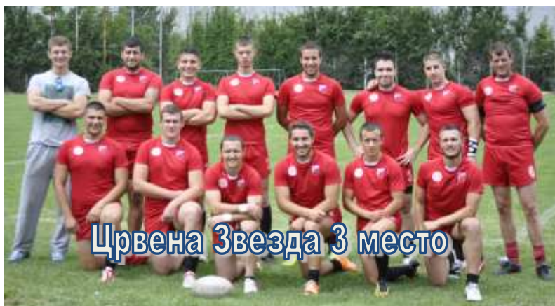
Црвена Звезда 3 место