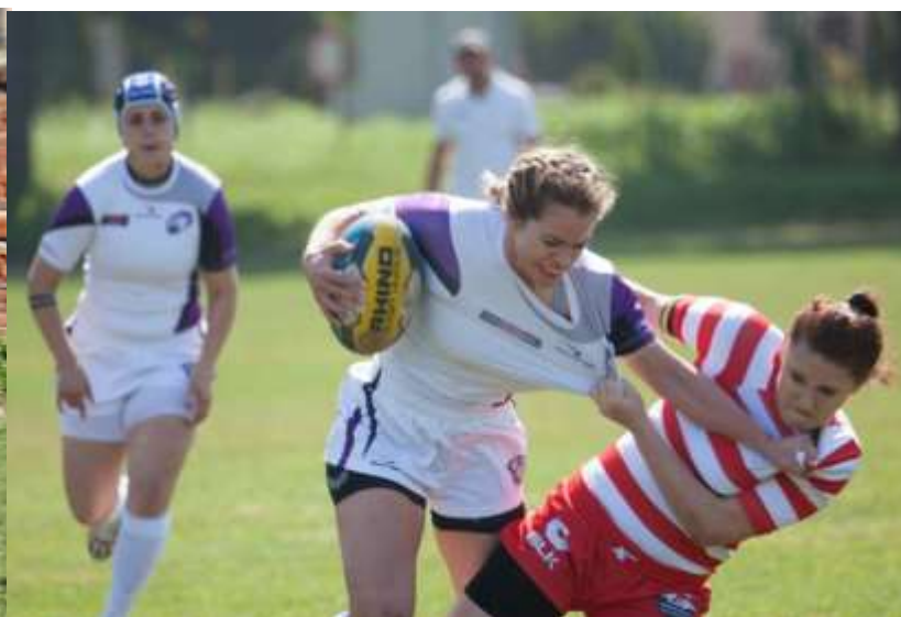
Слике са рагби 9 турнира у Будимпешти (мушкарци и жене) и Лесковца.