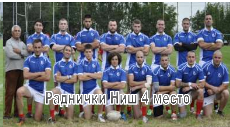
Раднички Ниш 4 место